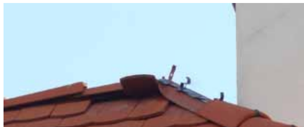
Obr. 6a Úder blesku do ochranného prostoru aktivního jímáče ESE přes střešní konstrukci stavby

Po úderu bleskového proudu o hodnotě 7 kA (10/350 \mu s) do chráněné části stavby aktivním jímáčem ESE byly zničeny veškeré elektronické systémy (EPS, EZS a CCTV) (obr. 6a, 6b). Tím byly vyřazeny velice důležité obvody, které zabezpečovaly nejen ochranu objektu, ale také protipožární opatření.