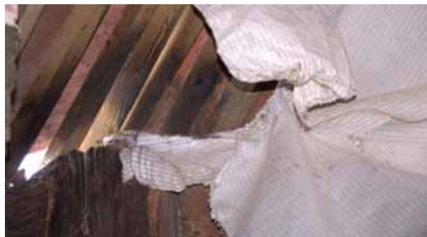
Obr. 6b Účinky bleskového proudu na střešní konstrukci stavby