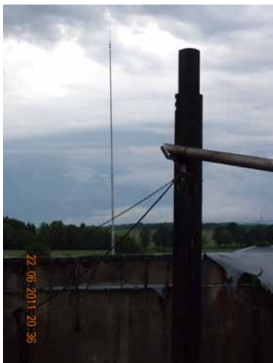
Obr. 5 Úder blesku do ochranného prostoru aktivního jímáče ESE

Blesk o hodnotě 18 kA (10/350 \mu s) udeřil do horní části fermentoru. Bezprostředně poté nastal výbuch a požár stanice. Horní díl fermentoru se nacházel asi 26 m od samostatně stojícího aktivního jímáče. Byl tedy v ochranném prostoru jímáče ESE.