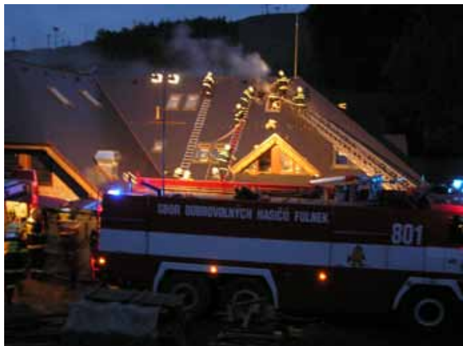
Obr. 4 Přeskok bleskového proudu z hromosvodu na vnitřní klimatizaci

Po úderu blesku o hodnotě 111 kA (10/350 \mu s) do jímáče ESE začal hořet hotel. Příčinou vzniku požáru byl přeskok bleskového proudu na vnitřní klimatizaci, která se nacházela pod jímáčem.